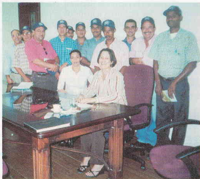
Directivos, técnicos de la ADEPE mientras participan en un encuentro con dirigentes del Comité de Manejo de Cuenca del Río Jamao

Continuando con su línea de apoyo solidario a los (as) beneficiarios (as) del Proyecto Desarrollo Agroforestal del Río Jamao, entidad que agrupa 2 mil productores (as) de frutales, árboles maderables y frutos menores, la ADEPE, atendiendo una solicitud del Comité de Manejo de Cuenca del Río Jamao, dio apertura a un fondo rotatorio, que permite a los directivos del Comité, disponer de recursos financieros para insertarse en los mercados nacionales e internacionales, con otros productores de la zona, los cuales están produciendo aguacates y zapotes en cantidades y calidades cada vez más mayores.