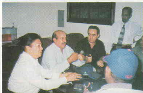
Foto de la izq., reunión de directivos de la ADEPE mientras compartían en camaradería con miembros de la prensa en la provincia Espiñán.

En este nuevo años de logros y realizaciones, la ADEPE a través de las diferentes asociaciones de comunicadores sociales, extiende a esos vigilantes de la democracia, sus más sincero agradecimiento y afecto.